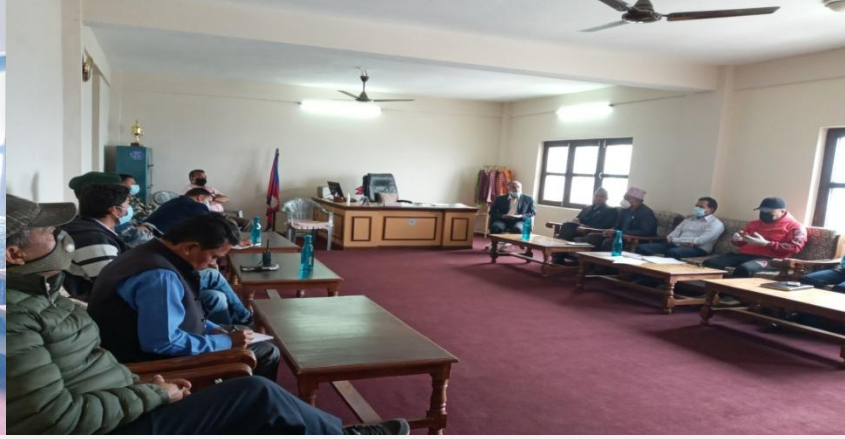
अर्थिक मामिला तथा योजना मन्त्रालयका माननीय मन्त्रीज्यूको उपस्थितिमा बसेको विपद व्यवस्थापन सम्बन्धी बैठकका