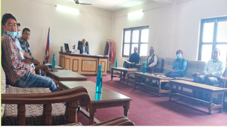
जिल्ला प्रशासन कार्यालय, सल्यानमा बसेको DCCMC बैठक