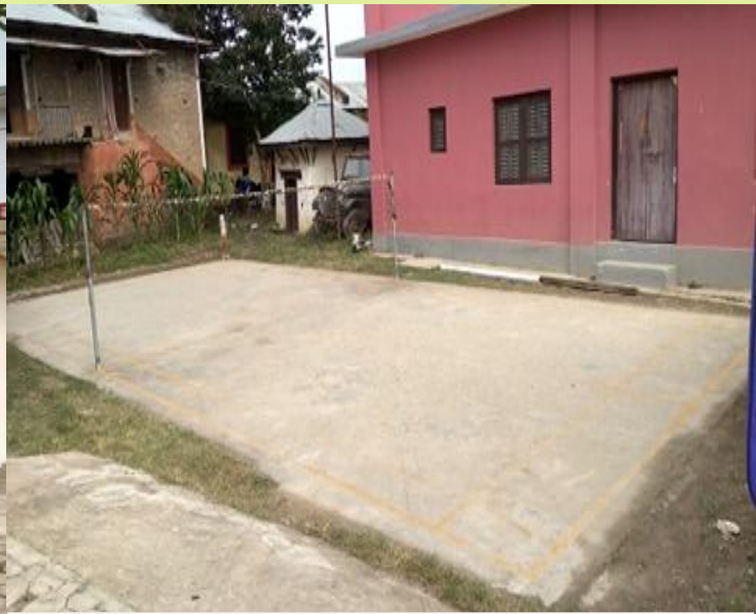
जिल्ला प्रशासन कार्यालय सल्यानमा रहेको Badminton court