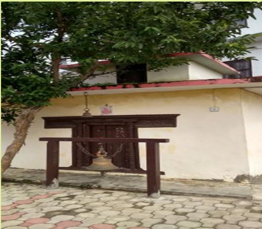
जिल्ला प्रशासन कार्यालय सल्यानको परिसरमा रहेको कृष्ण मन्दिर